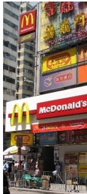
McDonald's in Hongkong

(Die 1940 gegründete Firma McDonald's betreibt Schnellrestaurants in etwa 120 der 195 Länder der Erde und bietet überall das gleiche Essen an: Burger.)