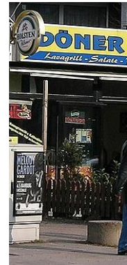
Döner in Hamburg

(Im 16. Jahrhundert nannte man in Amerika geborene Spanier „Kreolen“. Heute meint man mit „Kreolisierung“ die Vermischung verschiedener Kulturen.)