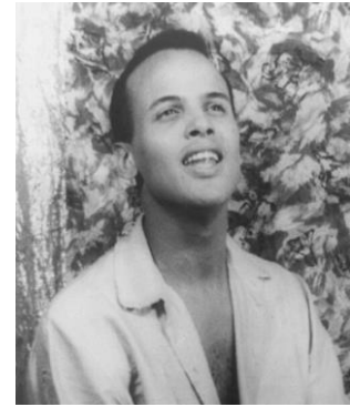
Harry Belafonte

Fast die Hälfte ihrer Bewohner*innen stammt von Afrikaner*innen ab, die vor langer Zeit als Sklaven hierher gebracht worden waren. Deshalb ähnelt der Rhythmus des Calypso dem Rhythmus der westafrikanischen Musik. Auch die Rhythmusinstrumente ähneln afrikanischen Instrumenten, z. B. Conga und Bongos. Der Gesang und die Gitarrenbegleitung klingen aber ziemlich europäisch.